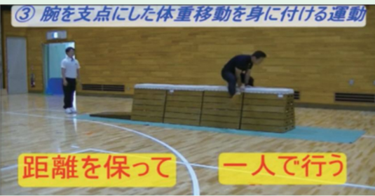
【器械運動系 跳び箱運動】

感染症対策を講じた上で、「どのような工夫をしたら実施できるのか」、また「どのようにすれば、それぞれの運動が有する特性や魅力に応じて、その楽しさや喜びを味わわせることができるのか」について検討する必要がありますと考えています。そこで、コロナ禍における体育の授業づくりの参考にさせていただくために、指導のポイントや留意点をまとめ、ホームページに「新型コロナウイルス感染症対策を講じた体育授業の運動例」を掲載しました。